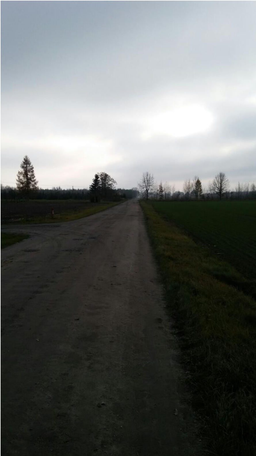
Rysunek 1 Miejsce montażu słupa oświetleniowego solarno-wiatrowego (przykład)